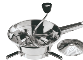
MOULIN-LEGUMES INOX 24 CM