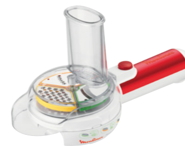
FRESH EXPRESS MOVE