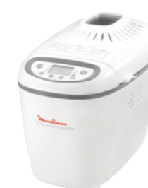
HOME BREAD BAGUETTE