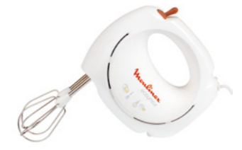
EASY MAX ABM11A