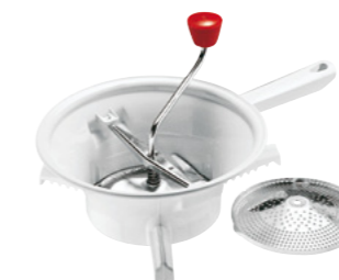
MOULIN-LEGUMES PLASTICA 24 M