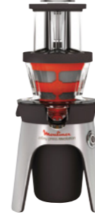
INFINY PRESS REVOLUTION