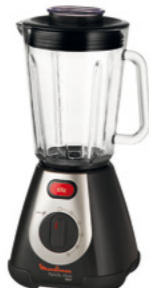
FACICLIC MAXI GLASS