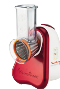
FRESH EXPRESS +