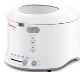
UNO L PLASTIC