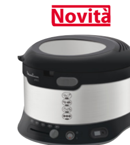
UNO L METAL