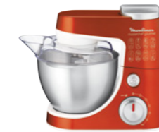
MASTERCHEF GOURMET PASTA